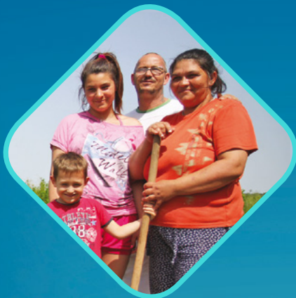
ÖKUMENIKUS SEGÉLYSZERVEZET BARANYA VÁRMEGYE