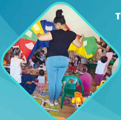
SOMOGYVÁR KÖZSÉG ROMA NEMZETISÉGI ÖNKORMÁNYZATA SOMOGY VÁRMEGYE