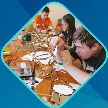
ISKOLAKULTÚRÁÉRT - ESÉLYTEREMTÉSÉRT EGYESÜLET GYŐR-MOSON-SOPRON VÁRMEGYE