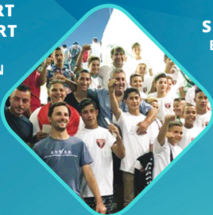
PISONT ISTVÁN TEHETSÉGGUTATÓ, FEJLESZTŐ ÉS GONDOZÓ ALAPÍTVÁNY BÉKÉS VÁRMEGYE