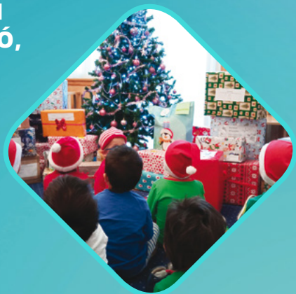
SZTEHLO GÁBOR INTEGRÁLT SZOCIÁLIS ÉS GYERMEK- VÉDELMI INTÉZMÉNY PEST VÁRMEGYE